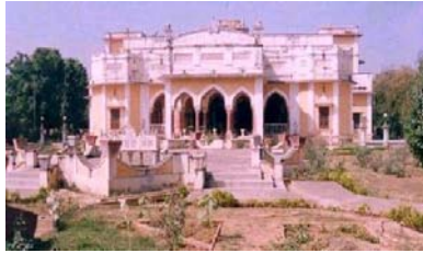
भंवर विलास पैलेस